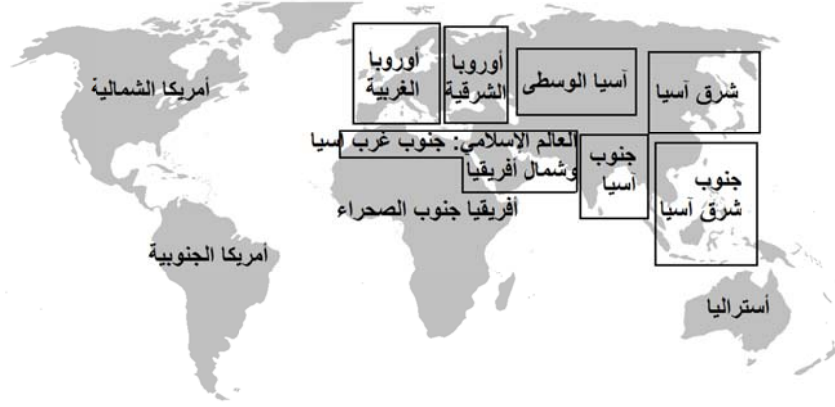
خريطة للعالم توضح أمتداد المناطق العالمية السبع وجوارها الجغرافي.

يعرض الفصل الأول أسباب هذا التقسيم الذي يستخدم الكاثوليكية الرومانية الغربية والأرثوذكسية الشرقية محكاً لفصل أوروبا الغربية عن الشرقية، ويضيف القسطنطينية بعد سقوطها بيد الأتراك العثمانيين إلى العالم الإسلامي، ويبقي على إندونيسيا وعالم الملايو في جنوب شرق آسيا مع جيرانهم البوذيين، بدلاً من نقلهم إلى العالم الإسلامي بعد اعتناقهم الإسلام.