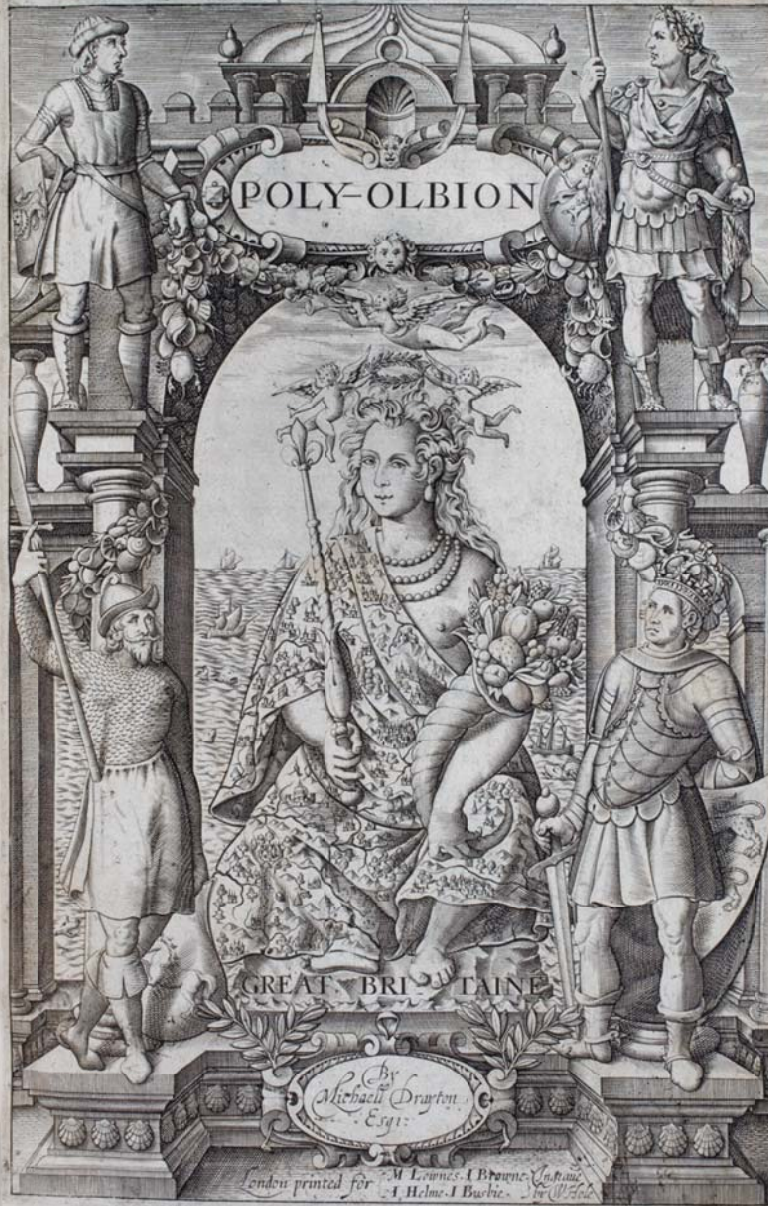
غلاف كتاب "بولي اليبون" أو "بريطانيا المتنوعة" الذي كان من أول الأعمال الشعرية التي وصفت العلاقة بين القوة والوفرة